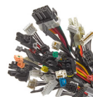
電力とシグナル用 ケーブルアセンブリー