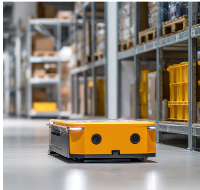
自動モバイルロボット

Molexは、色分けオプション、ポジティブロック機構、強化された接点保護、樹脂強化構造を特徴とする電線対基板用コネクタでこうしたニーズに応え、モバイルアプリケーションにおけるコネクタの耐久性を維持しています。これを補完するのが、個別配線オプション、頑丈なオーバーモールド設計、圧着済みリード、カスタマイズ可能な構成を備えた信号ケーブルと低電力ケーブルです。これらの要素で構成される接続ソリューションは、AMRに信頼性の高い電力管理と安全なデータ転送性能を提供し、産業環境全体における安全かつ効率的でスケーラブルな運用を実現します。